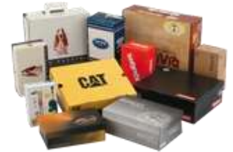
Empaques y productos