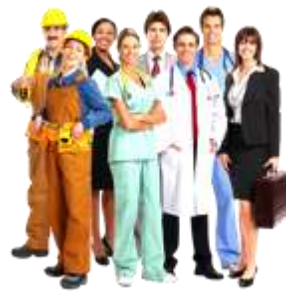
Uniformes y zapatos